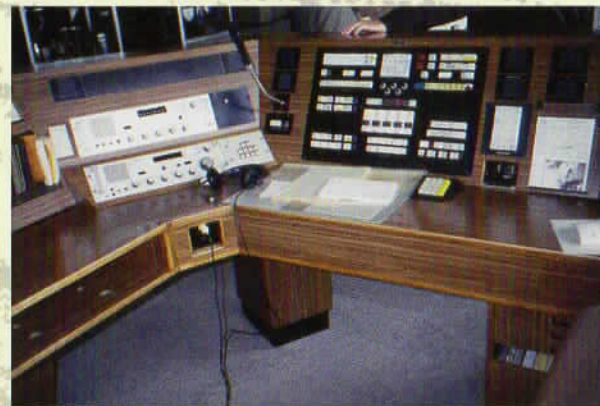
.....von 1982 bis zum Ende 1998